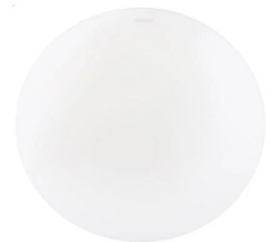
โคมฝ้ากลม