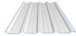
Metalsheet 0.40mm.กรู PEหนา 0.5cm.