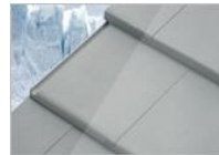
เพรสติจ สิคลาสสิคเกรย์

Green โครงหลังคาเหล็ก หรือ เหล็กสำเร็จรูป Truss