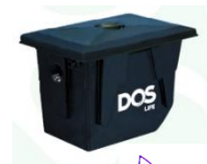
ถังดักไขมัน DOS G-TEKฝังใต้ดิน40 ลิตร