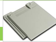
นิวสโกล์ เกรย์แกรนิต