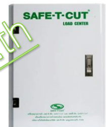
ตู้คอนโทรล 1เฟส หรือ 3เฟส