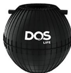
ถังบำบัด dos LIFE HERO1600 L