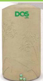
ถังเก็บน้ำ 2,000 ลิตร DOS คอส รุ่น Natura