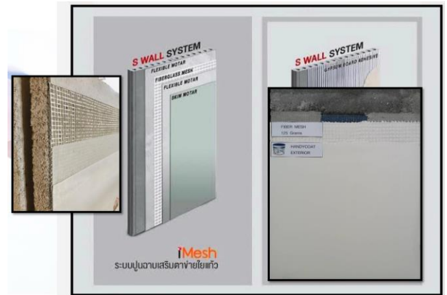
ผนัง FINISHpanel หนา10 cm.