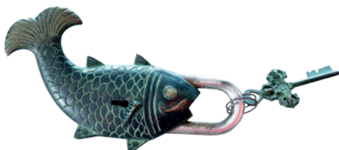
กุญแจรูปปลา ราคาหลักร้อย จาก ประเทศเพื่อนบ้าน สาธารณรัฐประชาชนลาว

6 ของตกแต่งบ้านที่สะสมจากการเดินทาง เมื่อนำมาจัดวางได้ ถูกต้อง ก็ยิ่งบอกเล่าเรื่องราว สะท้อนตัวตนแนวคิดเจ้าของบ้านได้ โดยไม่ต้องอ้ออึ้ง