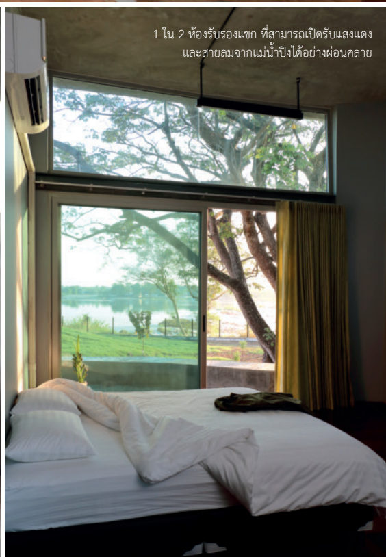
1 ใน 2 ห้องรับรองแขก ที่สามารถเปิดรับแสงแดด และสายลมจากแม่น้ำปิงได้อย่างผ่อนคลาย