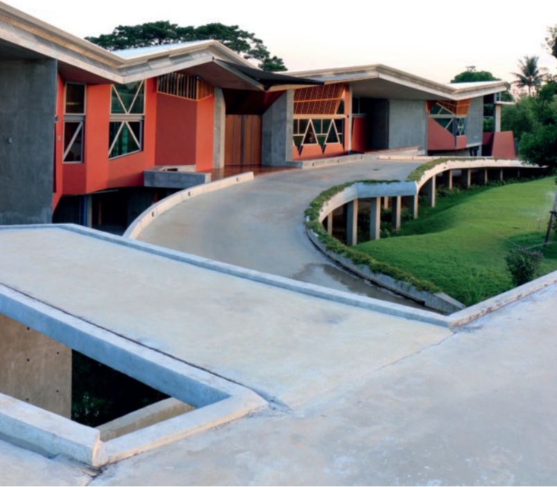
เส้นทางลาด (Ramp) ที่โยงใยจากหน้าบ้านสู่ตัวบ้านเพื่ออำนวยความสะดวกต่อผู้สูงวัย