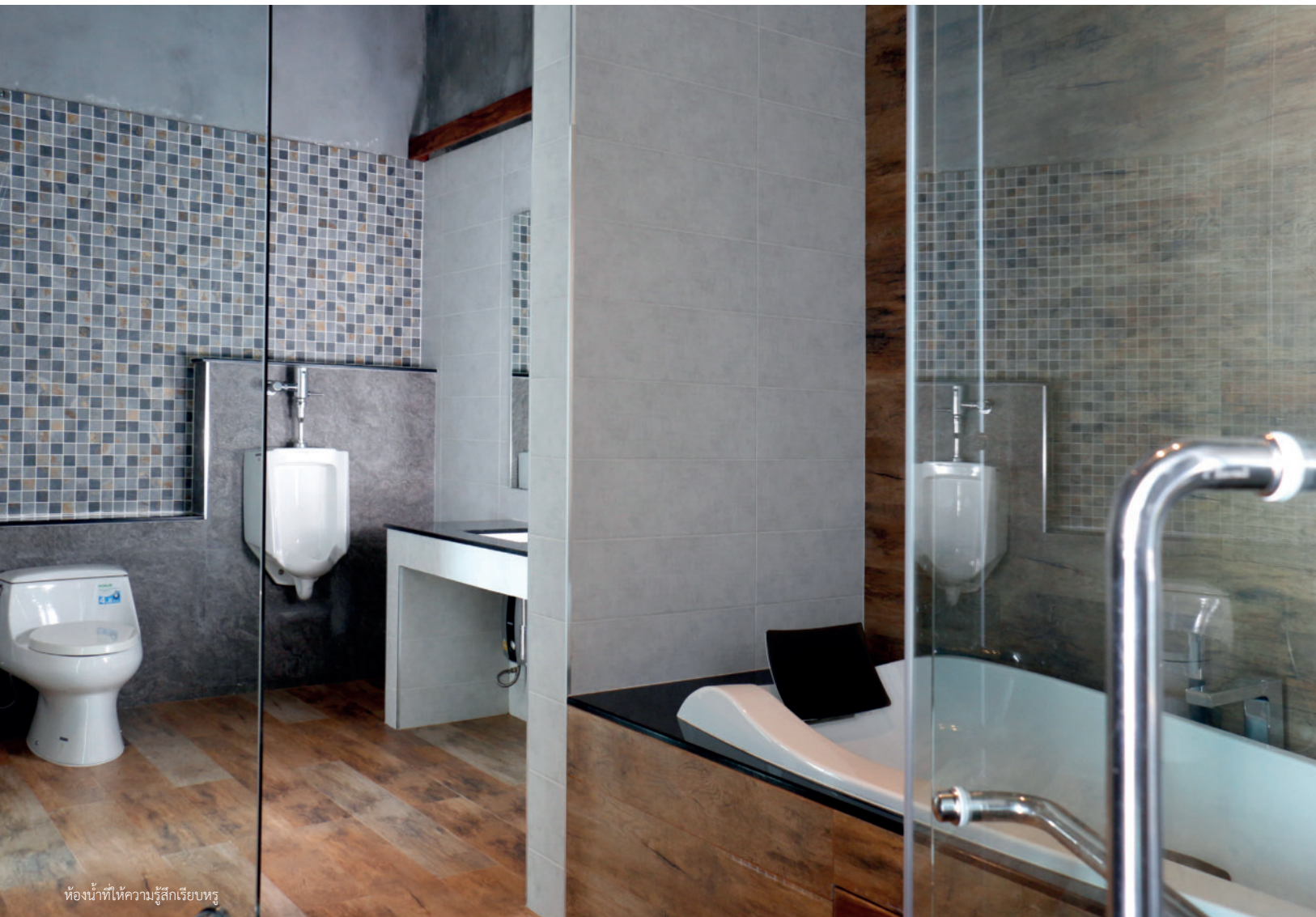
ห้องน้ำที่ให้ความรู้สึกเรียบง่าย