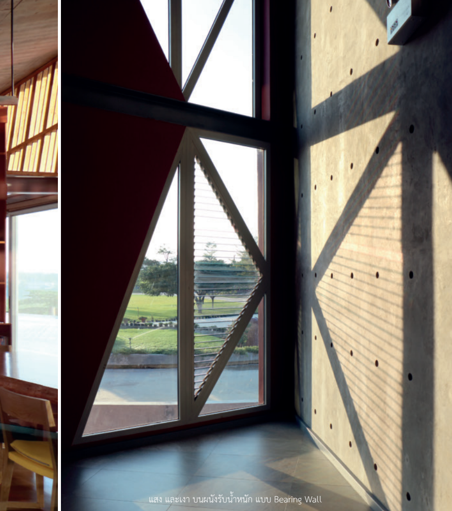
แสง และเงา บนผนังรับน้ำหนัก แบบ Bearing Wall