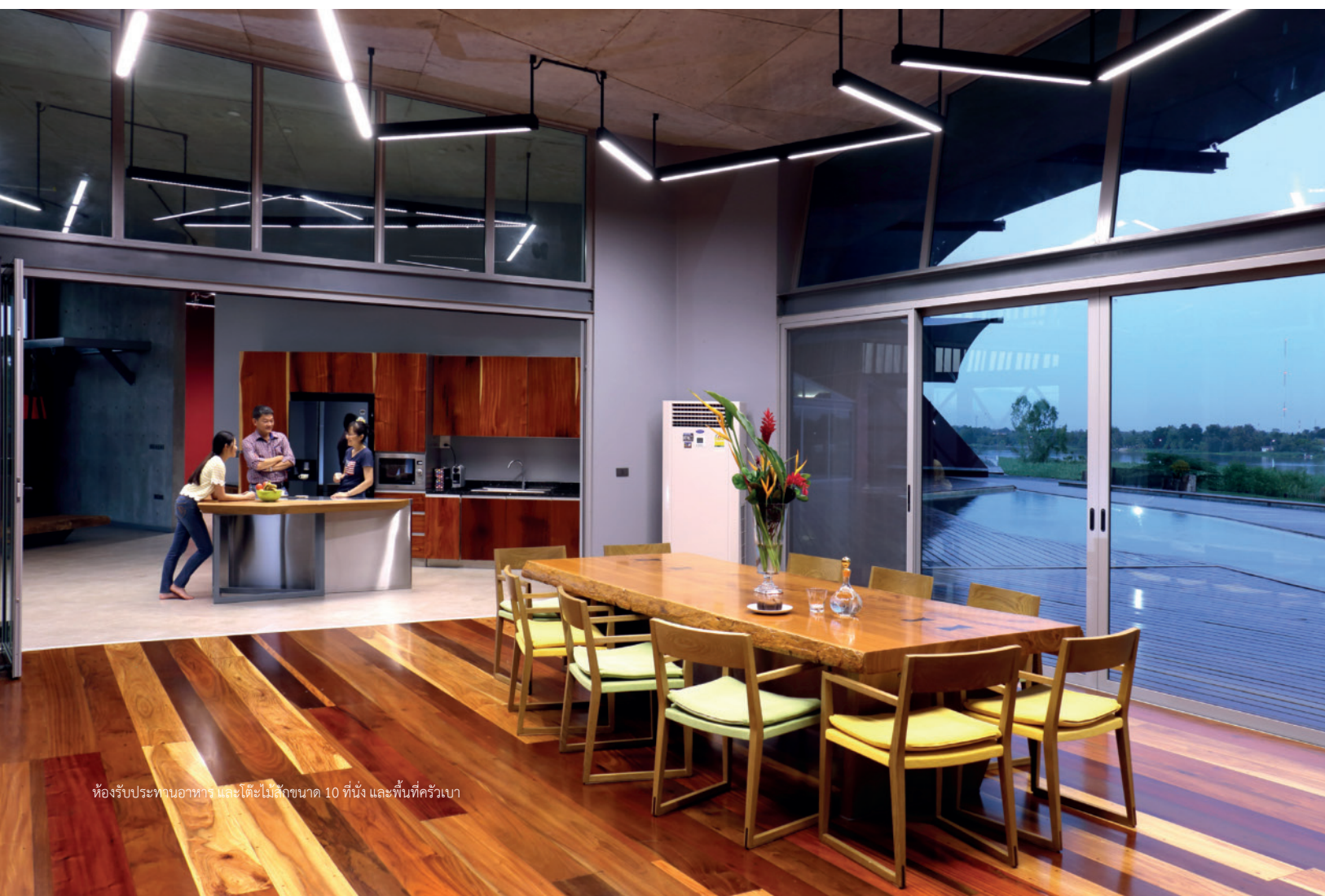
ห้องรับประทานอาหาร และโต๊ะไม้สักขนาด 10 ที่นั่ง และพื้นที่ครัวเบา