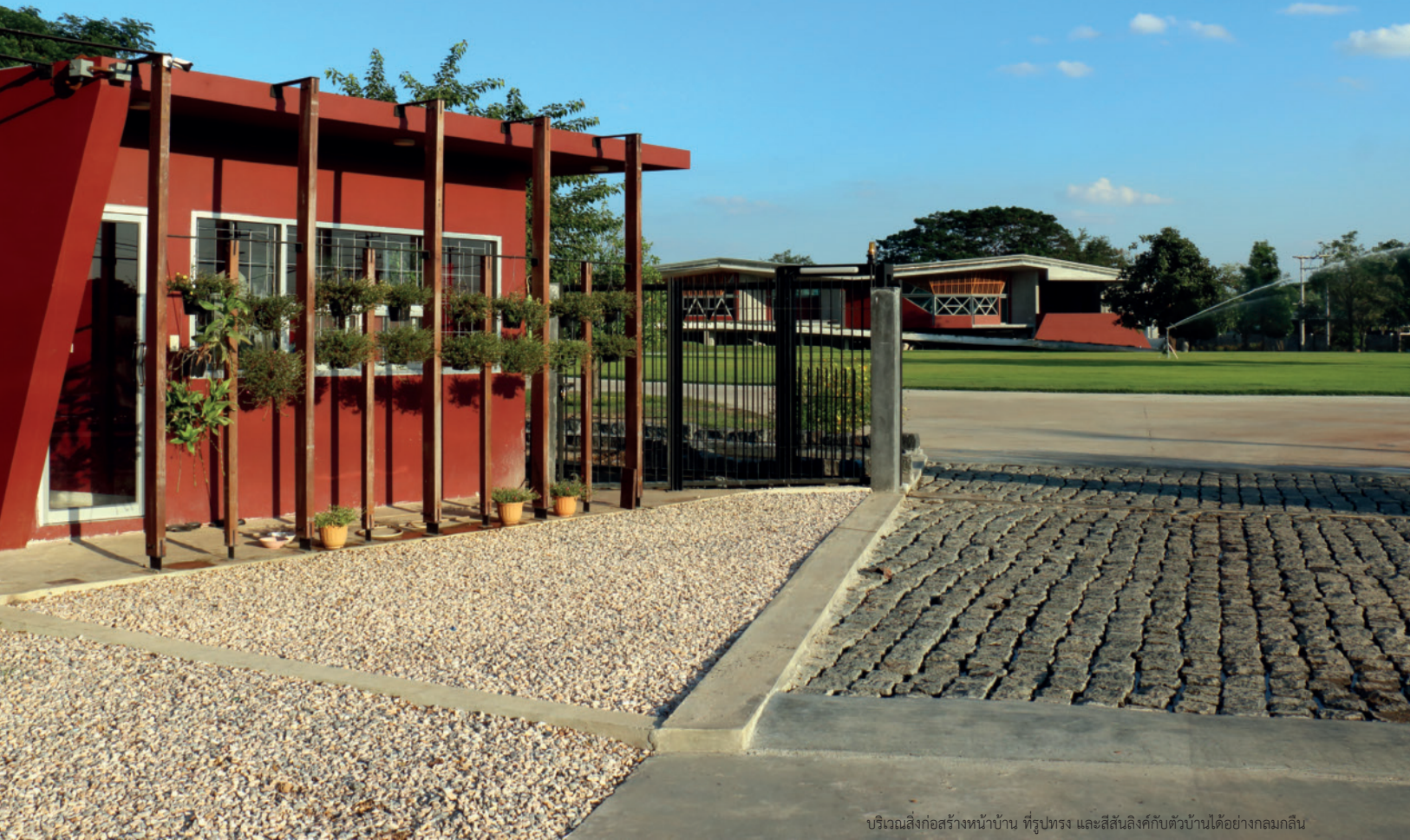
บริเวณสิ่งก่อสร้างหน้าบ้าน ที่รูปทรง และสีฉูดฉาดกับตัวบ้านได้อย่างกลมกลืน