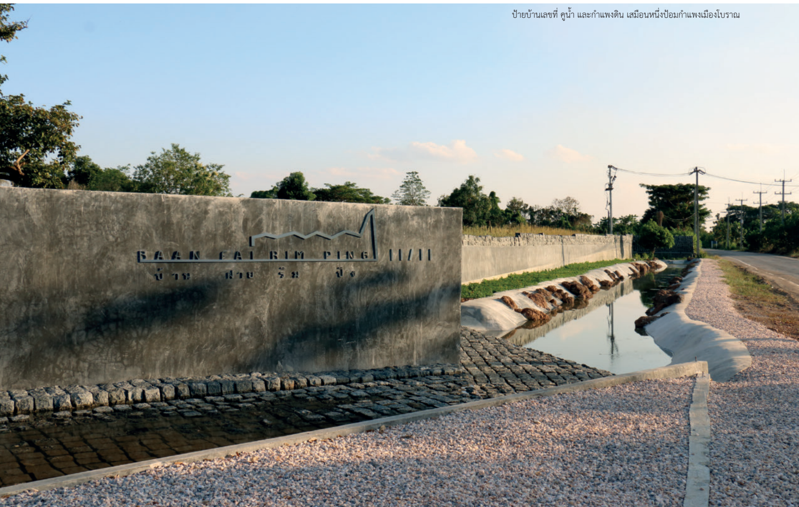
ป้ายบ้านเลขที่ คุน้ำ และกำแพงดิน เสมือนหนึ่งป้อมกำแพงเมืองโบราณ