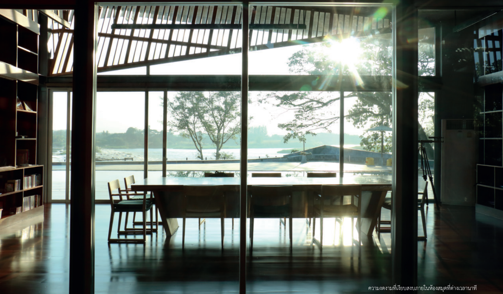
ความงดงามที่จับสบงภายในห้องสมุดที่ต่างเวลานาที

Feel the happiness of local living through sensual perceptions in this beautiful modern loft home near the most stunning view of River Ping located at 11/11 Moo 1 Songdham, Muang, Kampaengpetch. A home that minimizes all of the necessities and rewards the homeowner with its beauty every minute.