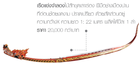
เรือแข่งจำลองไม้สักบุคตาสระรอง ฝีมือช่างเมืองน่าน ที่อ่อนเรือขงตงาน ปราดเปรียว ด้วยสีทาสองชั้นอยู่ ความกว้างX ความยาว 1: 22 เมตร ผลิตได้ปีละ 1 ลำ ราคา 20,000 กว่าบาท