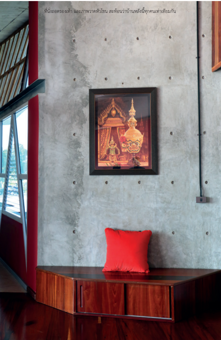
ที่นั่งถอดรองเท้า และภาพวาดหัวโขน สะท้อนว่าบ้านหลังนี้ทุกคนทำเทียมกัน

“ทุกห้องถูกออกแบบนั้นใช้จริงทุกห้องนะครับ เพราะผมเน้นการใช้งานในชีวิตประจำวันเป็นหลัก ด้วยลักษณะของการออกแบบที่เน้นประโยชน์ใช้สอยทำให้สมาชิกภายในครอบครัว 5-6 คน ใช้สอยครบทุกตารางนิ้วบนพื้นที่ 13 ไร่ ประกอบกับการเลือกกระจกสไลด์บานใหญ่เป็นวัสดุหลัก ทำให้บ้านมีอากาศถ่ายเทได้สะดวกแล้ว และสว่างด้วยแสงธรรมชาติ จึงทำให้ประหยัดพลังงานเป็นพิเศษ เพราะโครงสร้างเหนือเพดานหนา 25 เซนติเมตร แลยังมีช่องว่างระหว่างคอนกรีต และเหล็ก 60 เซนติเมตร ขณะที่ด้านบนสุดเป็นเมทัลชีท ช่วยป้องกันแสงแดด ทำให้อากาศด้านถ่ายเทได้เป็นอย่างดี