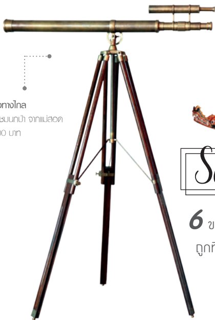
กล้องส่องทางไกล ที่ใช้สำหรับชมนกป่า จากเมืองดัตช์ ราคา 6,000 บาท