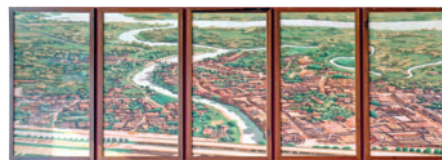
ภาพถ่ายกล้องสองเลนเทกา บังบอกที่บันทึกทำเปิดตัวตน ราคา 50,000 กว่าบาท ใส่วอลวด 1 1/2 ผลงานศิลปินท้องถิ่น จ.กำแพงเพชร