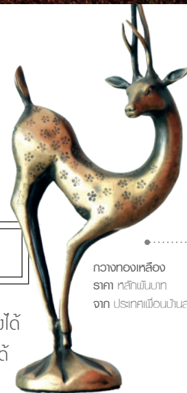
กวางทองเหลือง ราคา หลัพันบาท จาก ประเทศเพื่อนบ้านสาธารณรัฐประชาชนลาว