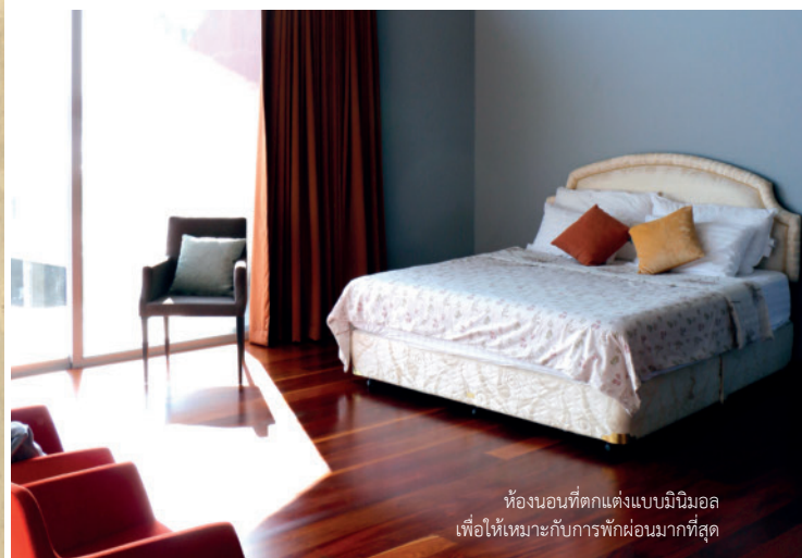
ห้องนอนที่ตกแต่งแบบมินิมอล เพื่อให้เหมาะกับการพักผ่อนมากที่สุด