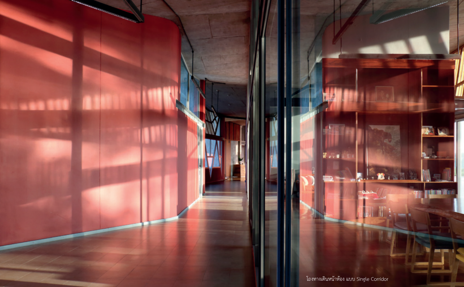
โถงทางเดินหน้าห้อง แบบ Single Corridor

“You can see the river view from every room in the house even though each room has a different view of the River Ping. All of the 4 bedrooms are designed to stay above the weir while the guest area is located at the most beautiful spot so everyone in our family or our friends can relax and enjoy a different view of a sunset on a daily basis. Every room is in use because I want a practical house that serves our daily routine”, says Khun Kriangkrai. Due to its functionality to serve 5-6 family members on these 13 Rais premise, a large sliding glass door is the main material used in this house. It does not only help with better airflow and natural light, it is designed with special structure to help with energy efficiency. Its overall structure is 25 centimeters in thickness and 60 centimeters gap between concrete and steel. The metal sheet is on top which reduces sunlight and a better air circulation.