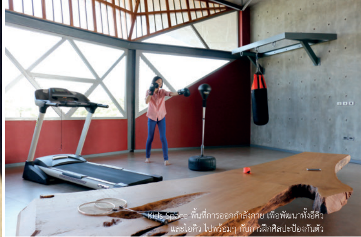
Kids Space พื้นที่การออกกำลังกาย เพื่อพัฒนาทั้งอึดใจ และไอคิว ไปพร้อมๆ กับตารางฝึกศิลปะป้องกันตัว